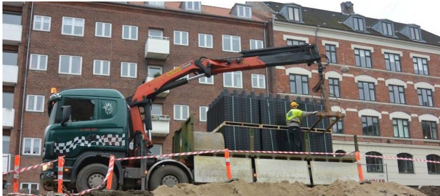
ACO StormBrixx ankommer.