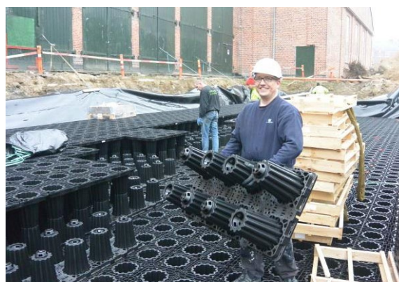
Med en vægt på kun 10 kg, kan de enkelte elementer hurtigt installeres.