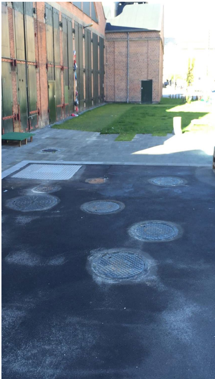
Efter endt installation er forpladsen nu blevet til et brugbart friareal.