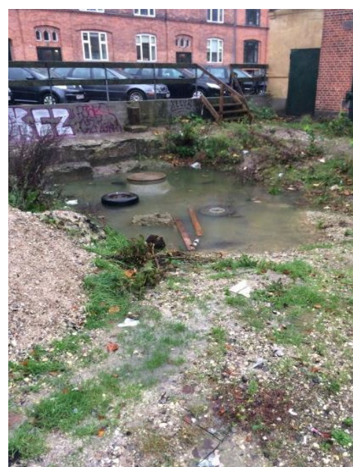
Før udgravning af ACO StormBrixx.

I dag er installationen færdig, og arealet over tanken vidner ikke om den 600 kubikmeter store tank, der ligger nedenunder.