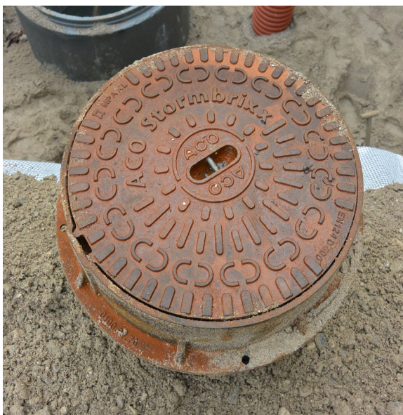
Inspektionselement for inspektion og vedligeholdelse afsluttes med specielt karm/dæksel mærket med ACO StormBrixx.