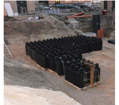
ACO StormBrixx klar til installering.