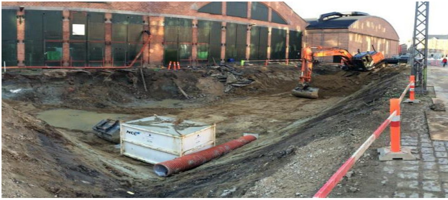
Udgravning for ACO StormBrixx.