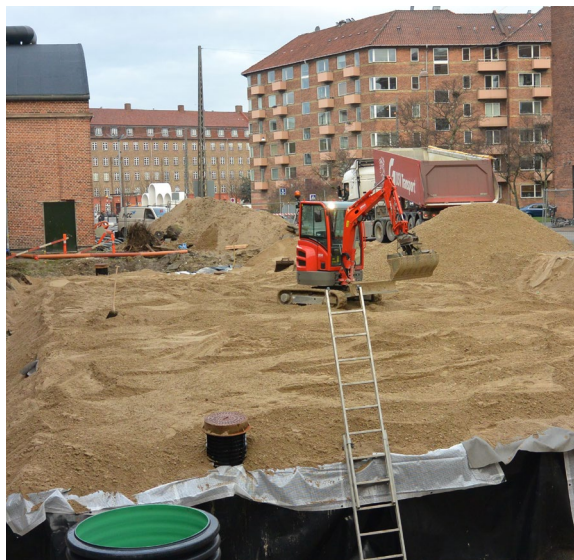
De færdig monterede StormBrixx elementer dækkes slutligt med grus før endelig belægning udføres.