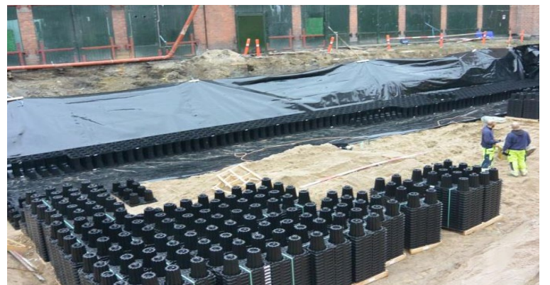
ACO StormBrixx leveres med 16 grundelementer pr. palle, hvilket svarer til 3,5 m 3 faskine.