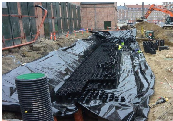
Membran udlægges og montering af ACO StormBrixx starter.