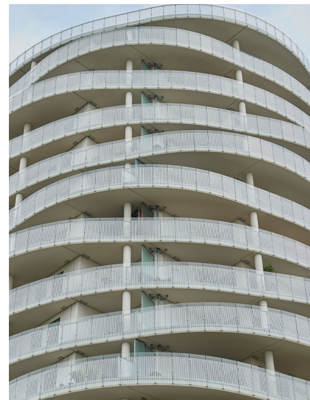
ACO GMX rør går igen på alle etager og afvander fra tag. Perfekt integreret i de karakteriske altaner.