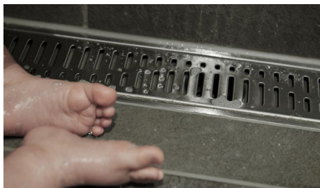
ACO ShowerDrain falder perfekt ind i de stilfulde omgivelser.