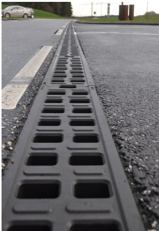
ACO liniedræn model Monoblock RD200 i antracit farve sikre en yderst diskret og sikker afvanding.