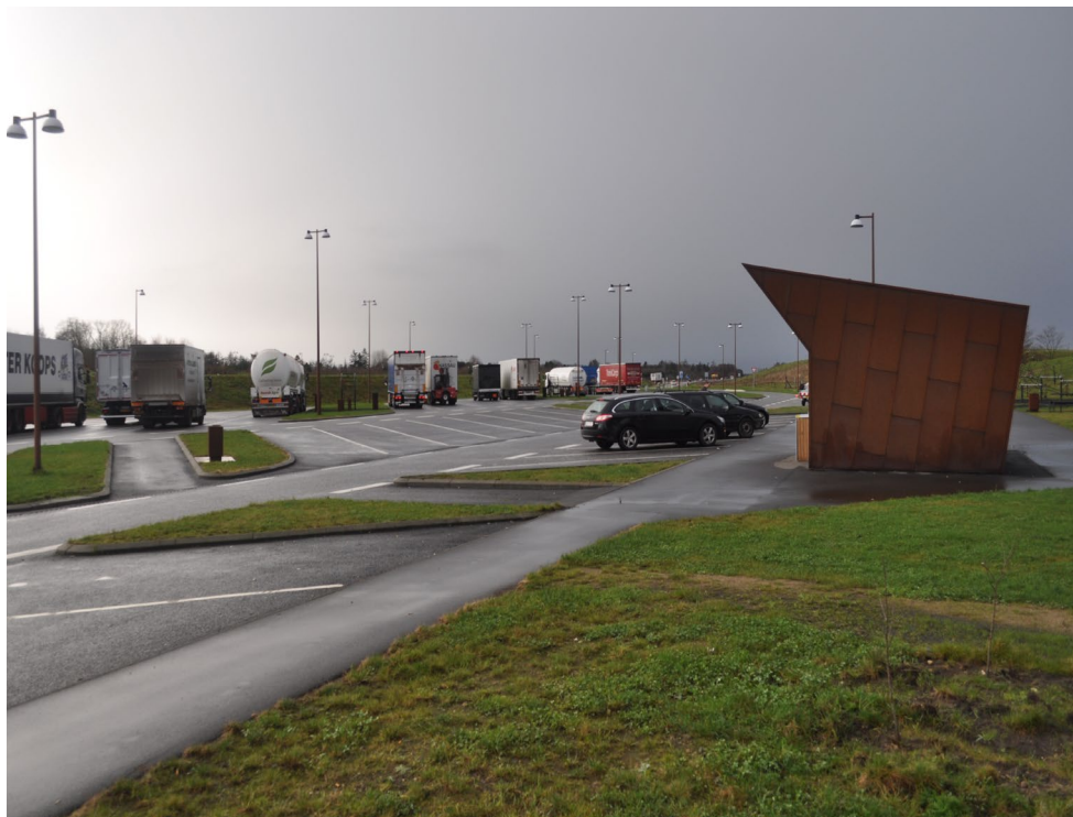
Med etablering af disse rasteplasser er der skabt mulighed for, at trafikanter kan tage et hvil, her er både toilet faciliteter, legeplads til børnene og hundeskov.