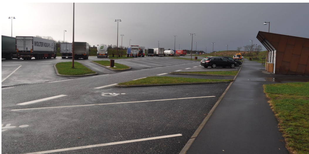
Selv på en regnvejrsgdag, er der ikke mulighed for vandpytter, da der er lavet ensidig fald hen til renden. Dette giver et godt helhedsindtryk og tilfredse gæster