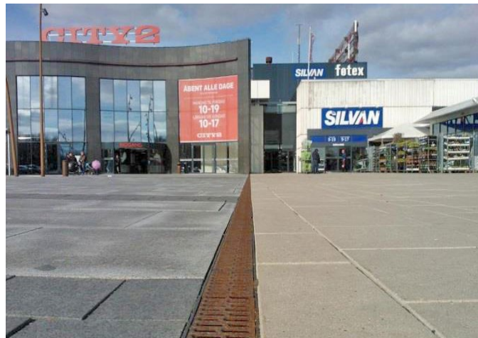
Multiline V100PP installeret ved granitbelægning på sydsiden af City2.