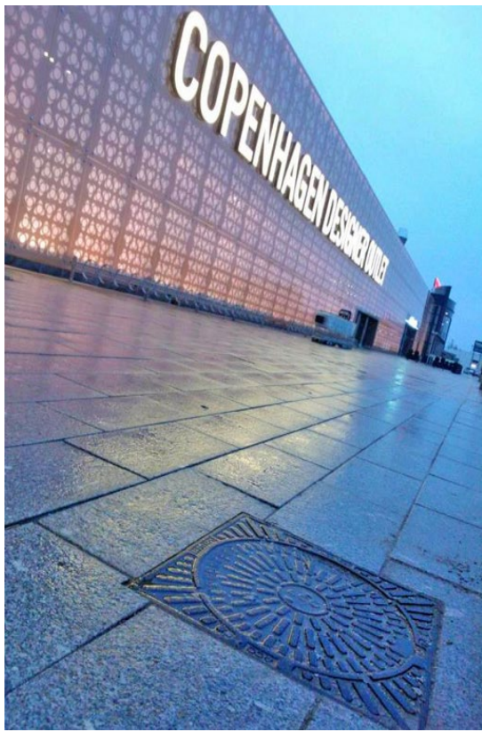
ACO Brøndgods flot integreret i granitstenbelægning.