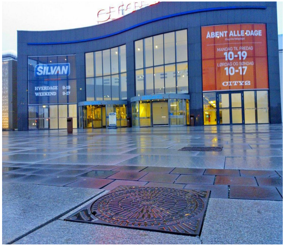
ACO Brøndgods er installeret flere steder rundt om City2, her vist ved nordlig indgang.