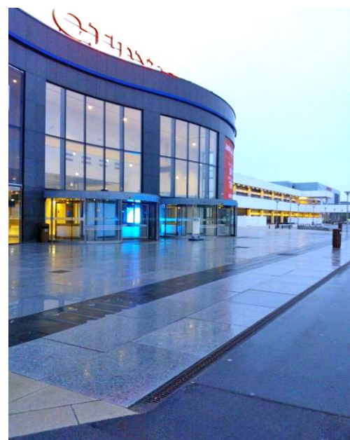
City2 har fået ny flot gratinbelægning hele vejen rundt, hvor der både er installeret ACO brændgods og linjedræn.

City2 med den seneste modernisering, blevet udvidet med Copenhagen Designer Outlet, 17.500m 2 med outlet butikker.