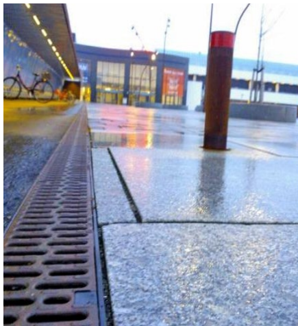
Multiline V100PP installeret ved granitbelægning på nordsiden af City2.