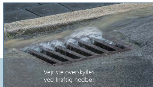
Vejriste overskyles ved kraftig nedbør

Kraftige nedbørshændelser forekommer hyppigere og hyppigere og fører til oversvømmelser i byer og forårsager store skader.